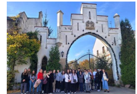
Geografia w plenerze – Dolina Bystrzycy

Przedmioty liczone w rekrutacji: j. polski, matematyka, j. obcy obowiązkowy, geografia