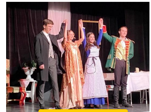
Spektakl Mąż i żona