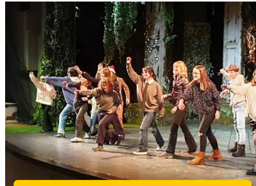
Warsztaty teatralne w Teatrze Polskim

Sprawdzian uzdolnień kierunkowych: 5-6.06.2023 r.