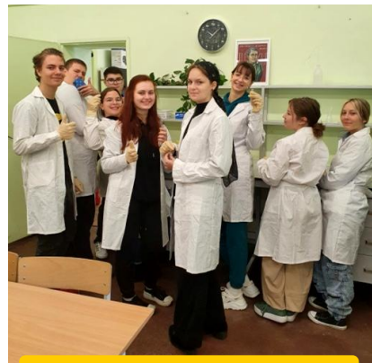
Zajęcia laboratoryjne z chemii

Przedmioty liczone w rekrutacji: j. polski, matematyka, j. obcy obowiązkowy, informatyka