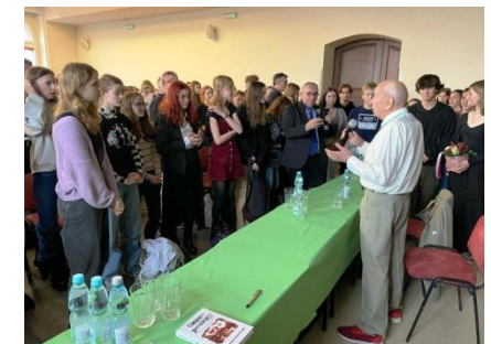
Forum Historyczno- Patriotyczne