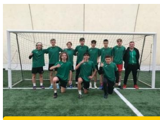
Reprezentacja szkoły w piłce nożnej