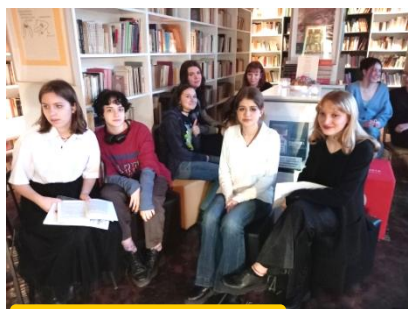
Wieczór poetycki w bibliotece