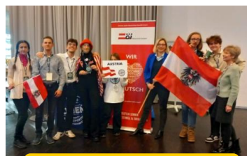
Koło Młodzieży przy LO nr XVII Towarzystwa Polsko-Austriackiego