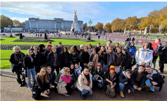
London – praktyczna nauka języka

Przedmioty liczone w rekrutacji: j. polski, matematyka, j. obcy obowiązkowy, geografia