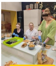
Akcja charytatywna Zupa na wolności