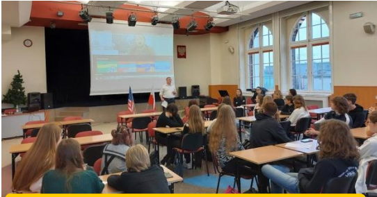
Warsztaty w j. angielskim American Politics

Przedmioty liczone w rekrutacji: j. polski, matematyka, j. obcy obowiązkowy, wos