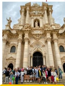
Obóz naukowy – Sycylia