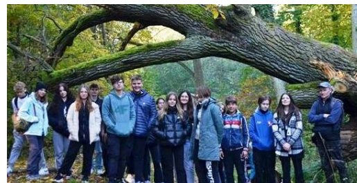
Śladami epoki lodowcowej – Wzgórza Trzebnickie

Przedmioty liczone w rekrutacji: j. polski, matematyka, j. obcy obowiązkowy, geografia