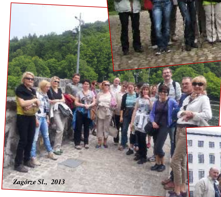
Zagórze Sl., 2013