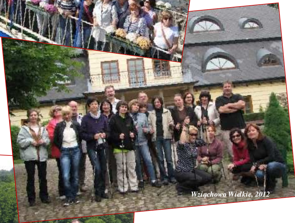
Wziąchowo Wielkie, 2012